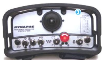
Ergonomické rádiové diaľkové ovládanie